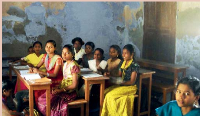
Venkovská škola bez investic, které do škol v Indii mívá z pražské Charity.

Rozvojové cíle tisíciletí přijaté v roce 2000 Organizací spojených národů přispěly ke snížení chudoby ve světě. Mnoho problémů však přetrvává. Mimo jiné jde o dostupnost vzdělání a kvalitu výuky ve vesnických školách v rozvojových zemích. Na řešení těchto problémů se zaměřuje řada projektů Arcidiecézní charity Praha.