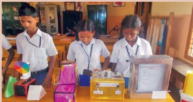
Zmodernizovaná učebna s pomůckami ve škole v chudinské čtvrti Jyothinagar.

Před patnácti lety podepsaly členské státy OSN Miléniovou deklaraci, v níž stanovily osm základních cílů pro odstranění největších problémů rozvojového světa do roku 2015. Společným úsilím chtěly odstranit extrémní chudobu a hlad, snížit dětskou úmrtnost a také do-