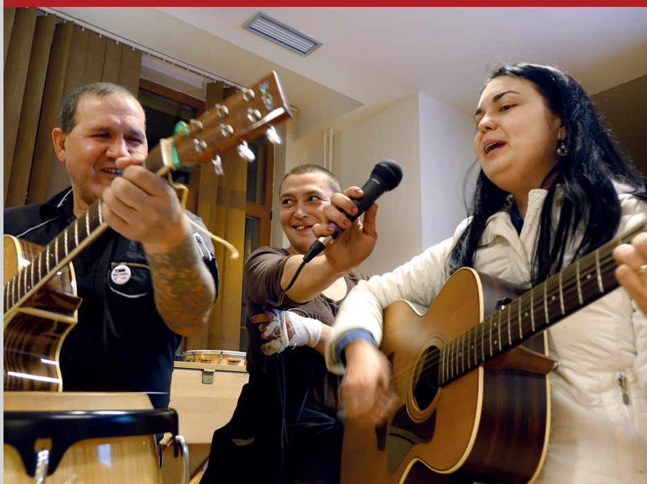
Noc venku pořádaná Farní charitou Beroun