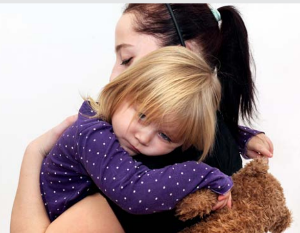
Tisíců dětí v Česku se dotýká problém domácího násilí.

Ano, přicházejí k nám lidé plní bolesti, na pokraji fyzických i psychologických sil. Nejhorší je, když si uvědomíme, že tu bolest jim nejčastěji způsobují jejich vlastní rodiče, partneři nebo blízcí. Každý příchozí má svůj příběh, jedinečnou situaci a cestu, kterou chce jít, na kterou mu můžeme nabídnout doprovázení. Kam každý z našich kli-