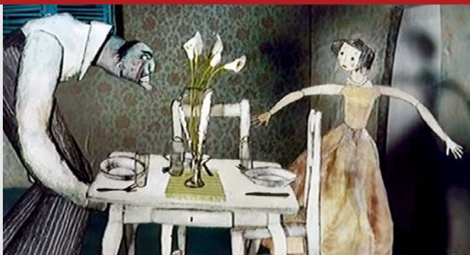
Film Zuřivec slouží pro práci s oběťmi i pachateli domácího násilí.

Ano. Násilí nejsou jen rány pěstí, ale má i podobu psychického týrání, které na svých partnerech páchají muži i ženy. O domácím násilí páchaném na mužích se moc nemluví, ale v praxi se s psychologickým týráním mužů setkáváme.