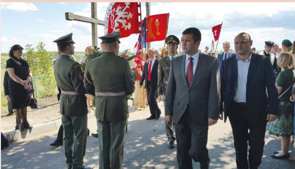
Oslavy 100. výročí bitvy u Zborova. Československým legionářům přijeli vzdát hold vrcholní politici.

Na dědu si pamatuji dobře, i když zemřel v mých jedenácti letech. Jezdil jsem za ním každý druhý víkend do Černošic. Ve vzpomínkách mi utkvěl jako veselý pohodový člověk, brzy vstával a cvičil, chodil na pivo, hrál s důstojníky ve výslužbě karty, vyráběl ovocné víno. Měl rád práci na zahradě, úspěšně pěstoval zeleninu i ovoce. Vzpomínám si, že jednou zapomněl klíče, když šel na návštěvu nemocného kamaráda. Řekl, že musel přelézt plot, bylo mu tenkrát 88 let. Teprve v dospělosti jsem si uvědomil, jaký to byl