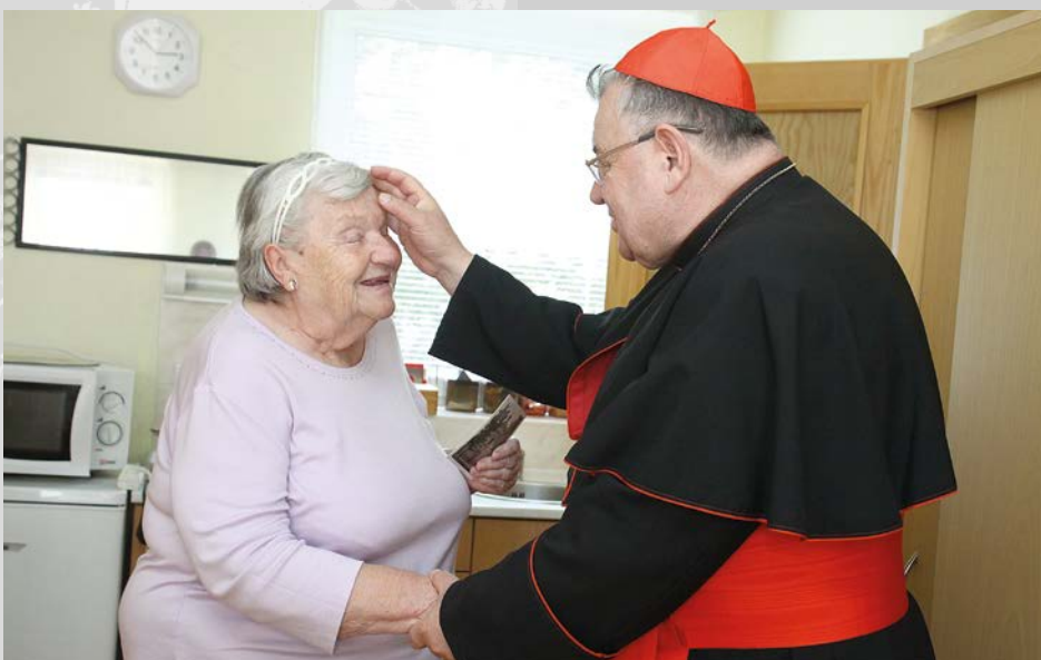
Kardinál Dominik Duka na návštěvě Domova pro seniory kardinála Berana v Mukařově.

Uvedu jednu vlastnost, která otce kardinála odděluje od ostatních úspěšných lidí. V době, kdy nikdo