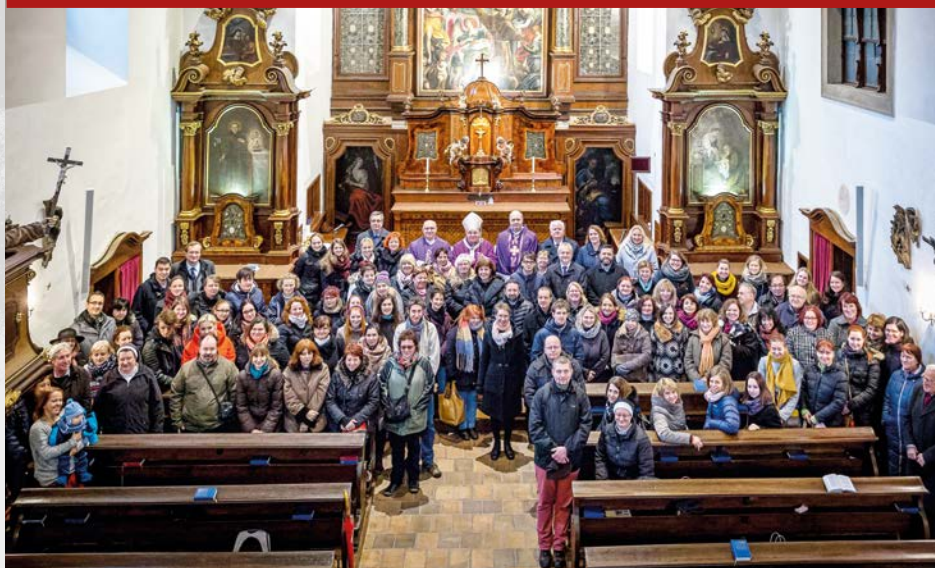
Mše svatá za pracovníky a dobrovolníky Charity, kterou kardinál Dominik Duka slouží v předvánočním čase.

Skupina politických aktivistů adresovala nedávno papeži Františkovi dopis, ve kterém kritizují pražského arcibiskupa Dominika Duku. Žádají Svatého otce, aby kardinálu Dukovi neprodložoval mandát a jmenoval nového pražského arcibiskupa. Dopis vyvolal silné reakce jak ze strany těch, kteří s touto iniciativou souhlasí, tak těch, kteří ji odmítají.