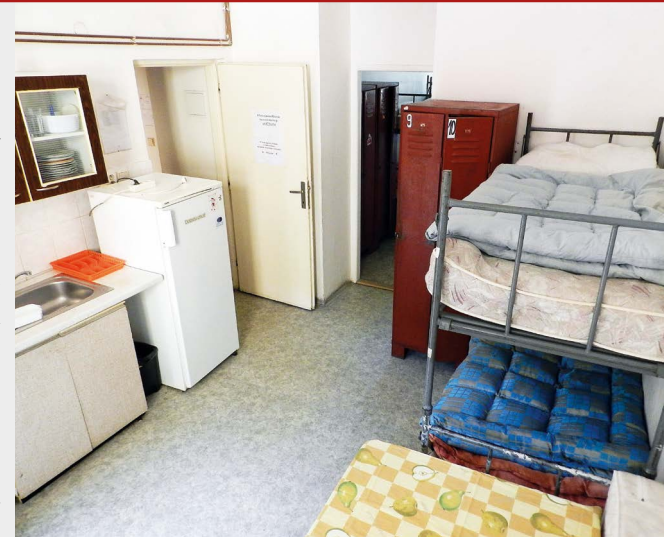
Noclehárna – místnost pro osm žen.

Je krátce po šesté večer, několik stupňů nad nulou. Zvoním u domu v pražském Karlíně. Po výstupu do schodů se dostávám do úzké křivoloké chodby. Předemnou stojí sedm mužů s batohy a čekají