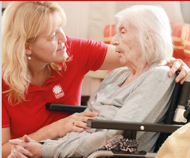
Senioři v Domově se zvláštním režimem prožívají díky pracovníkům a dobrovolníkům Charity důstojně stáří.